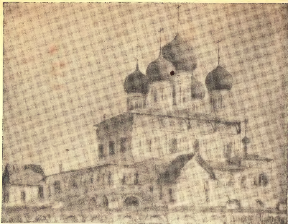
ВОСКРЕСЕНСКИЙ СОБОР В Г. ТУТАЕВЕ